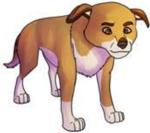
Stirrar - helt stilla - kalla ögon