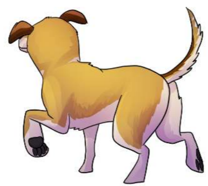
Går bort - ökar distansen