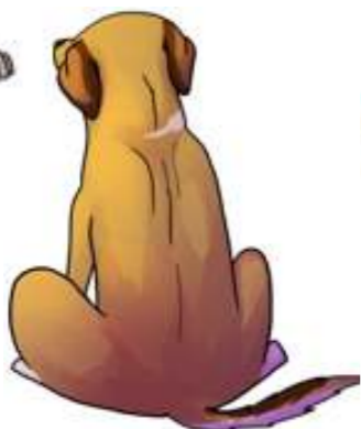
Sitter med ryggen mot det "jobbiga"