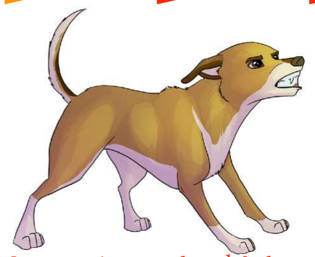
Morrar - visar tänder - hårda ögon