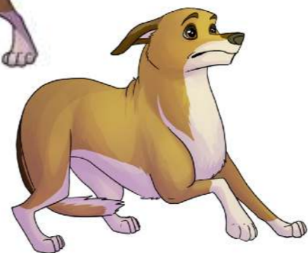
Ryggar - svans mellan ben - öronen bakåt-strukna