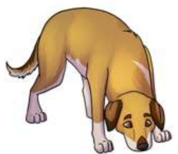
Luktar på marken