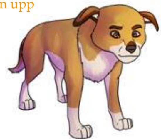
Stirrar - helt stilla - kalla ögon